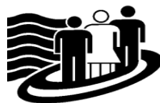
Table des partenaires du développement social de Lanaudière