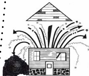
Maison des Jeunes Café-Rencontre 12-17 du Grand Joliette 34, 1 ère Avenue Notre-Dame-des-Prairies, (Qc) J6E 1R8 Tél.: (450) 756-4794