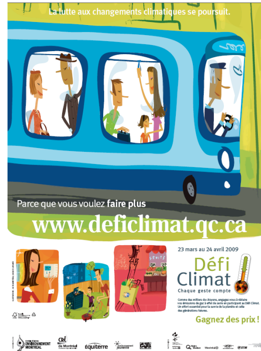
Affiche promotionnelle Format 18x24 po